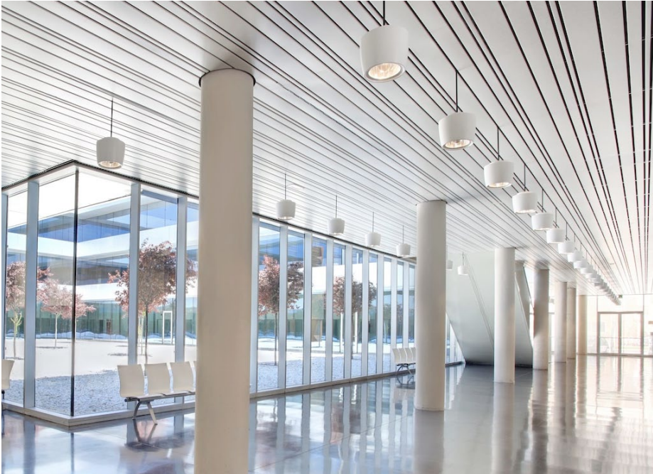
Sede de la oficina fiscal y judicial de Cuenca